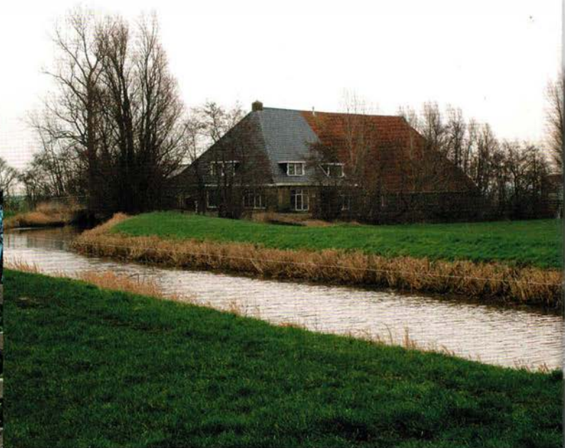
Boven: Stal frá Paradísarheimt betekent toepasselijk 'herwonnen paradijs'