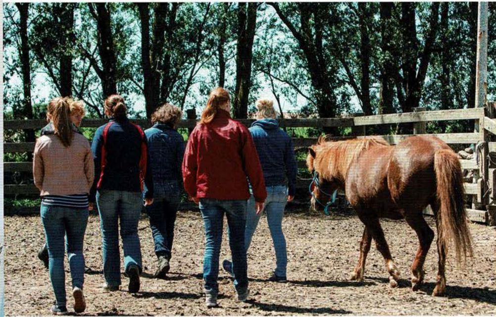
Boven: Teamcoaching met medewerking van Skritla frá Foksandi